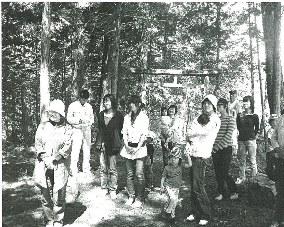
高鳥谷神社で説明を聞く参加者

も、この緑豊かな堀越の自然を大切に、いつまでも野生の動物園であればいい景観でした。